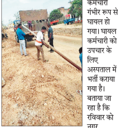
कर्मचारी गंभीर रूप से घायल हो गया। घायल कर्मचारी को उपचार के लिए अस्पताल में भर्ती कराया गया है। बताया जा रहा है कि रविवार को नगर

बलरामपुर। सड़क पर मौजूद विद्युत् पोल को हटाने के दौरान नगर पालिका का प्लेसमेंट