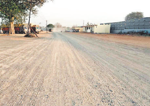
रेलवे गुड्स शेड की कच्ची सड़क।

गौरतलब है कि सरगुजा संभाग का इकलौता गुड्स शेड बिश्रामपुर में स्थित है, जो पिछले करीब छह दशकों से संचालित हो रहा है। यहां से सीमेंट, खाद्यान्न, उर्वरक, बीज सहित विभिन्न सामग्रियों का बड़े पैमाने पर रेल माध्यम से परिवहन किया जाता है, जिससे रेलवे को हर वर्ष करोड़ों रुपये का राजस्व प्राप्त होता है। लंबे समय तक उपेक्षित रहने के बाद केंद्र सरकार की