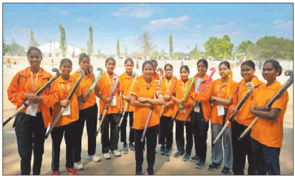
प्रतियोगिता में शामिल खिलाड़ी।

सरगुजा ओलंपिक की संभाग स्तरीय प्रतियोगिता में दूसरे दिन भी खिलाड़ियों ने अपनी खेती प्रतिभा का प्रदर्शन किया। खिलाड़ियों ने जिले के विभिन्न विधाओं में खेल का प्रदर्शन करते हुए अपने जिलों का नाम रोशन किया है। संभाग स्तरीय सरगुजा ओलंपिक प्रतियोगिता का समापन अब सोमवार को किया जाएगा। प्रतियोगिता के समापन कार्यक्रम में मशहूर खिलाड़ी और भारतीय फुटबॉल टीम के पूर्व कप्तान बाईचुंग भूटिया मुख्य अतिथि के रूप में शामिल होंगे और खिलाड़ियों का उत्साहवर्धन करेंगे। बता दें कि मुख्यमंत्री विष्णु देव साय की पहल पर संभाग स्तरीय सरगुजा ओलंपिक का आयोजन किया गया है। इस प्रतियोगिता के में विशेष रूप से ग्रामीण अंचलों में आए खिलाड़ियों ने न केवल मेडल की दौड़ में अपनी जगह बनाई है,